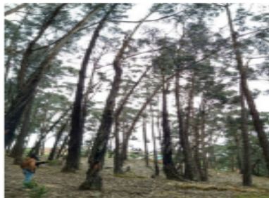
Foto 2 – Árbol afectado en la base de fuste de la especie Eucalipto común ( Eucalyptus globulus )