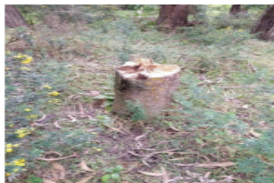
Foto 6 - Árbol talado de la especie Caucho Tequendama ( Ficus tequendamae )