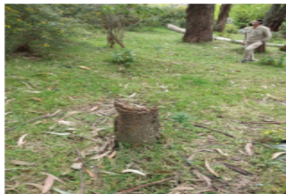
Foto 5 - Árbol talado de la especie Caucho Tequendama ( Ficus tequendamae )