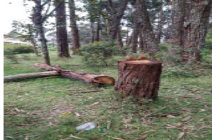
Foto 7 - Árbol talado de la especie Eucalipto común ( Eucalyptus globulus )