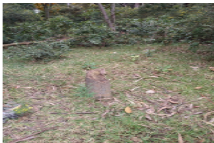
Foto 4 - Árbol talado de la especie Caucho Tequendama ( Ficus tequendamae )